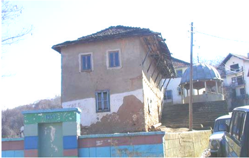
L'école de Llubovisht avant et après la rénovation par la DDC

La Direction du Développement et de la Coopération (DDC), Suisse, était déjà très active au Kosovo : Reconstruction d'institutions sociales, en particulier des écoles : 33 écoles, dont 10 constructions neuves, pour environ 10'000 écoliers et écolières. (Bulletin de la DDC de 2003)